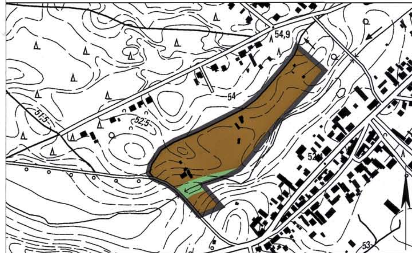
Darstellung der geplanten 7. Änderung des Flächennutzungsplanes in der Fassung vom 20.08.2015 Maßstab 1:5000 unmaßstäblich verkleinert

Plangrundlage DTK 2006, Landesvermessung und Geobasisinformation Brandenburg