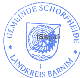
Uwe Schoknecht Bürgermeister