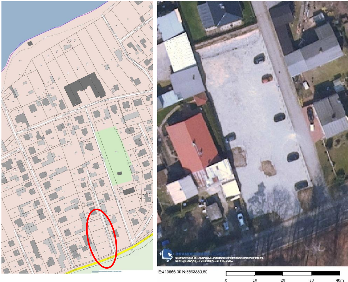
Abbildung 1: Lage des Geltungsbereiches im Gemeindegebiet

Das Plangebiet befindet sich am südlichen Rand des Ortskerns Altenhof der Gemeinde Schorfheide an der Ecke Joachimsthaler Straße / Kleine Gasse (siehe Abbildung 1).