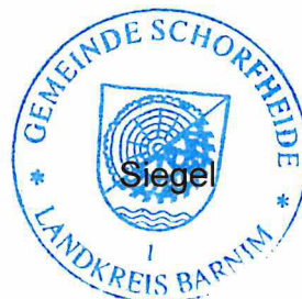
Wilhelm Westerkamp Bürgermeister