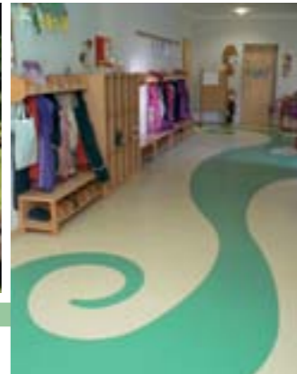
die neue Feng-Shui-Kita „Spatzennest“ in Finowfurt wird bezogen, Januar 2007