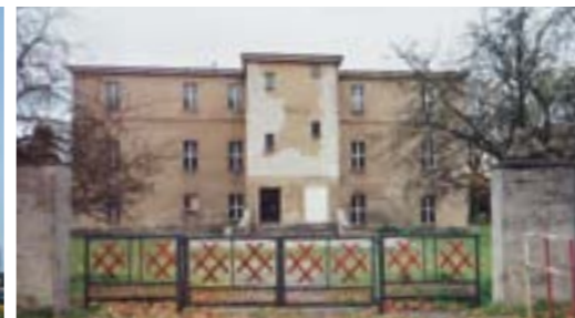
das Schloss in Lichterfelde ist dank neuem Dach und neuer Fassade wieder als solches zu erkennen, Dezember 2010