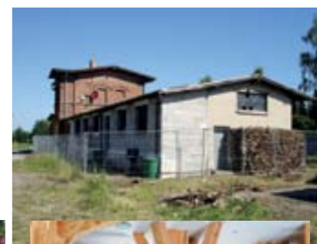
der Bahnhof in Groß Schönebeck ist saniert und beherbergt in seinem Inneren eine Ausstellung, Juni 2012