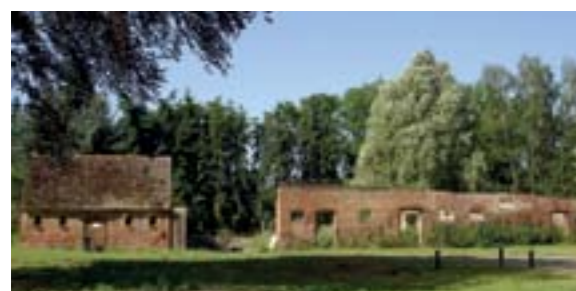
die neu gebaute Remise auf dem Schlossgelände in Groß Schönebeck wird als Touristinformation mit eigener Ausstellungsfläche eröffnet, Juni 2011