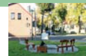
das marode Haus an der Ecke Hauptstraße/ Marienwerderstraße in Finowfurt ist abgerissen, die entstandene Freifläche gestaltet, September 2013