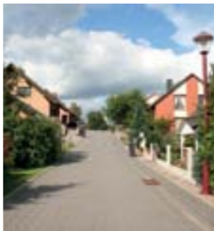
der Altenhofer Weg in Werbellin ist fertig, April 2006