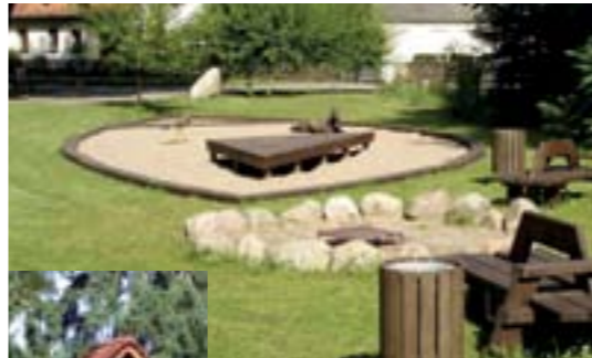
in Schlufft freut man sich über einen Spielplatz und einen Glockenturm, Mai 2006