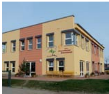
die Finowfurter Hortkinder haben ein neues Domizil, August 2010