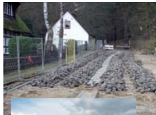
die Schulstraße in Eichhorst bekommt ein neues Pflaster, April 2009