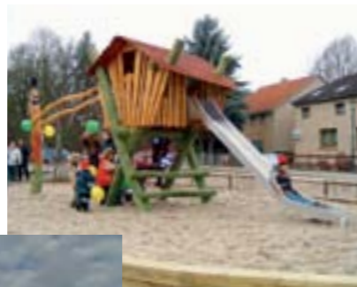
Eichhorst erhält einen Spielplatz an der Uferpromenade, November 2004