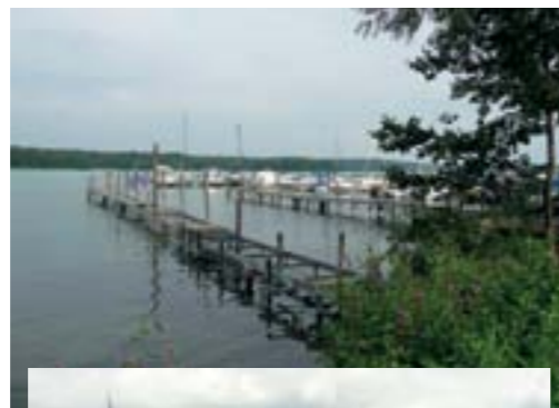
Erneuerung der Steganlage in Altenhof, Mai 2009