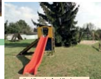
die Klandorfer Kinder erhalten einen Spielplatz im Ort, April 2011