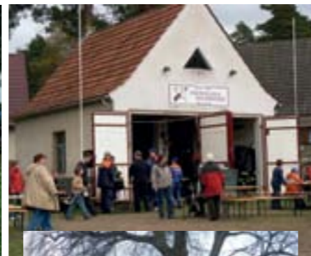
die Altenhofer Feuerwehr zieht in ihr neues Gebäude ein, Mai 2009