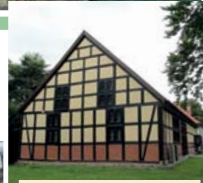
die alte Groß Schönebecker Schlossscheune wird Museums-scheune, Juni 2007