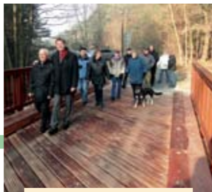
eine neue Brücke führt zum Weißen See in Böhmerheide, November 2011