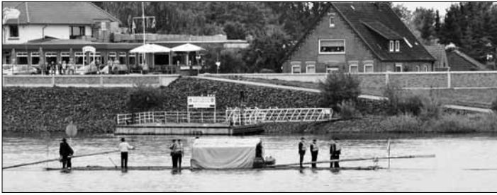
Floßbau historisch: die Finowfurter Flößer waren zum 23. Deutschen Flößertag in Lauenburg auf der Elbe unterwegs.