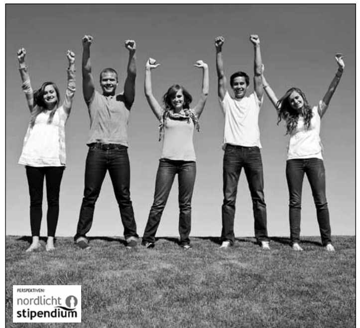
Hurra! Egal ob jung oder alt – Menschen mit sozialem Engagement können sich bei der Stiftung Nordlicht um ein Stipendium bewerben.

hilfe. Als Belohnung locken verschiedene Programme, die frei zur Auswahl stehen: Voll- und Teilstipendien für diverse Schüleraustauschprogramme in viele Länder weltweit und ein Volunteer-Stipendium für einen Freiwilligendienst inklusive Flug nach Asien. Die Kieler Austauschorganisation Kultur-Life stellt zusammen mit der Deutschen Kreditbank (DKB) diese Programme als Förderer zur Verfügung. Bewerben können sich junge und jung gebliebene Menschen aus der gesamten Bundesrepublik im Alter von 14 bis 65 Jahren. Erfahrungsberichte ehemaliger und aktueller Stipendiaten, nähere Beschreibungen zu den Voraussetzungen sowie die Bewerbungsunterlagen sind als Download unter www.nordlicht-stipendium.de zu finden. Bewerbungsschluss ist der 30. November 2010. Um die Stipendien auch in Zukunft anbie-