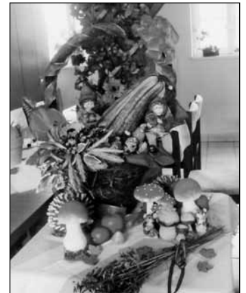
Herbstlich geschmückt ist der Treff der Senioren, die ProCurand Begegnungsstätte in Finowfurt.

Der Herbst hat wunderschöne Seiten, wie auch unser eigenes Leben. Keiner soll im Alter