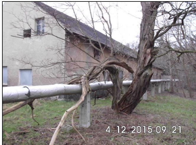
Abbildung 6: Stall, Rückseite