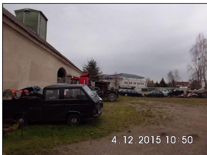
Abbildung 8: Scheune, Rückseite