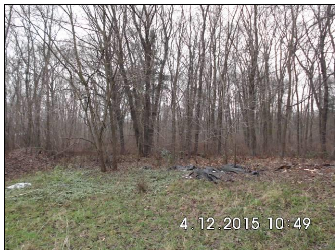
Abbildung 10: Fläche für Neubauten (neue Hofflügel)