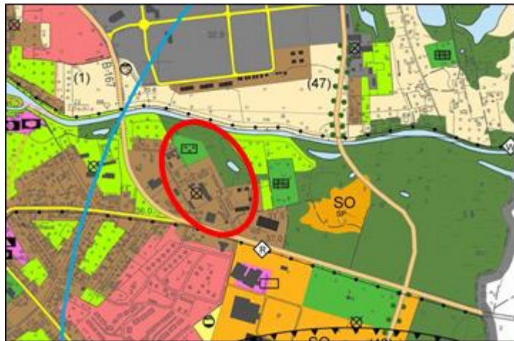
Abbildung 15: Auszug FNP (FNP Gemeinde Schorfheide 2009, Knieper+Partner)

Die Gemeinde Schorfheide verfügt seit Februar 2009 über einen rechtswirksamen Flächennutzungsplan. Im FNP ist das Plangebiet als gemischte Baufläche, Grünfläche mit Zweckbestimmung: Park sowie Wald ausgewiesen. Somit lässt sich der VBP aus dem FNP entwickeln.