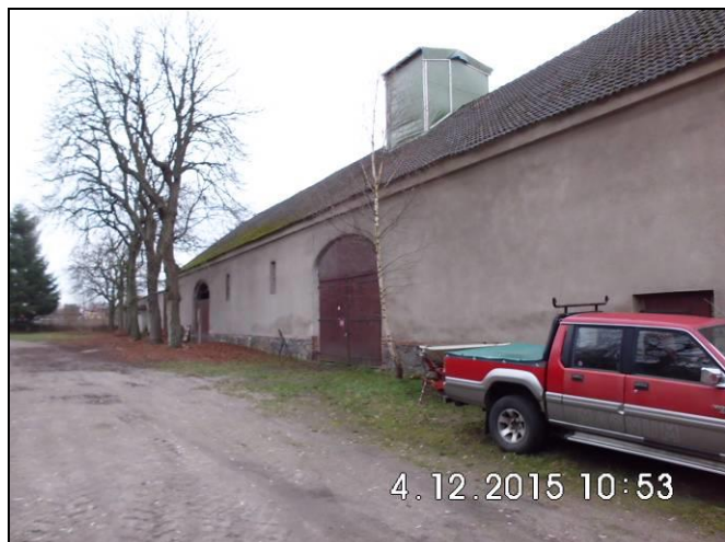
Abbildung 7: Scheune, Hofseite