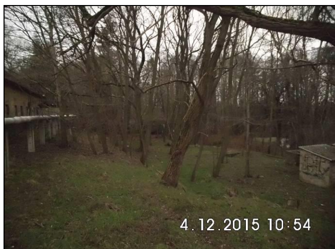
Abbildung 11: Fläche für Neubauten (Terrassenzeile)