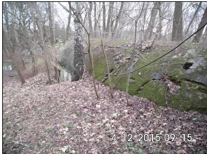
Abbildung 9: Bunker