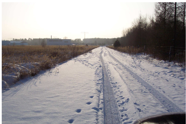
Abbildung 6: Konrad-Zuse-Straße (Nördliche Grenze des Geltungsbereiches)