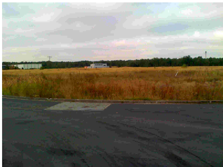
Abbildung 3: Blick von der Ernst-Abbe-Straße zur Karl-Zuse-Straße

Der BPL Nr. 24 „TGE- Gemarkung Lichterfelde“- 1. Änderung liegt nördlich der Stadt Eberswalde, nördlich des Oder-Havel-Kanals, südlich von Lichterfelde und wird weiträumig von Waldflächen umgeben. Die Flächen sind im Gebiet der Planänderung ungenutzt.