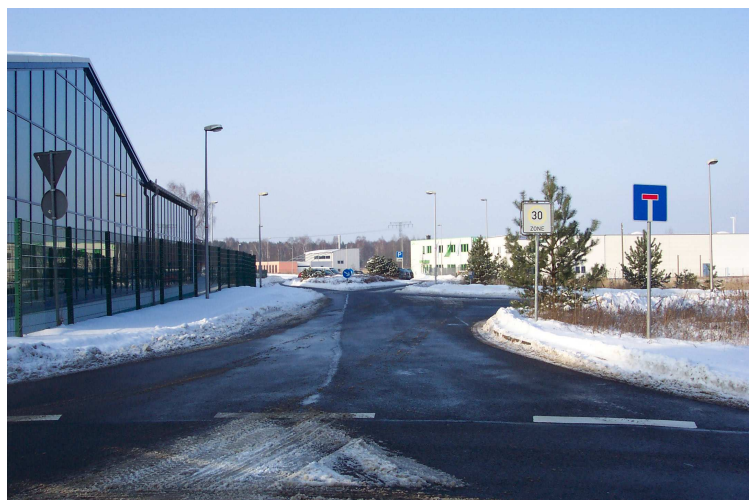
Abbildung 5: Carl-Zeiss-Straße