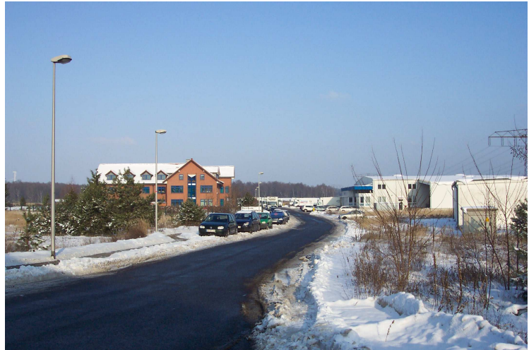
Abbildung 4: Ernst-Abbe-Straße

Das Plangebiet ist durch unmittelbare Lage an den öffentlichen Straßen „Carl-Zeiss-Straße“ und „Konrad-Zuse-Straße“ äußerlich erschlossen.