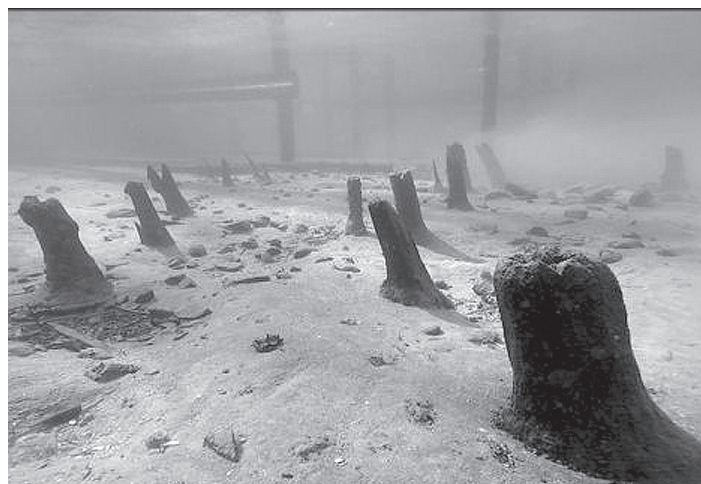
Östlicher Bereich der zentralen Pfahlkonstruktion.