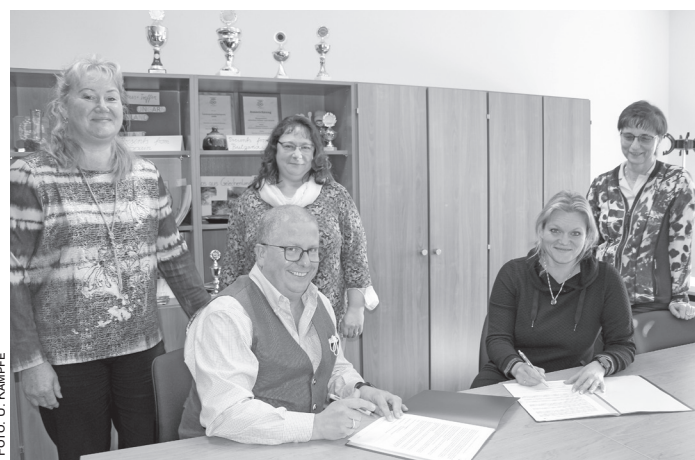
Vertragsunterzeichnung in der Finowfurter Schule. In einem bislang einmaligen Projekt sollen Kinder beim Übergang von der Kita in die Schule möglichst nahtlos gefördert werden.

Bisher endete eine solche Förderung für betroffene Kinder offiziell mit dem Ende der Kita-Zeit. In der Schule musste dann quasi wieder ein Neustart erfolgen. Betreut werden die Kinder